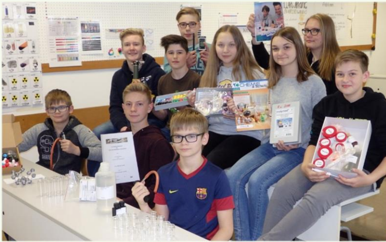
4. NMS mit Utensilien aus dem Materialpaket

"Die Chemie muss stimmen!" Die Wichtigkeit dieses Satzes ist uns sicher schon in vielen Lebenssituationen bewusst geworden. Damit die Chemie in chemischen Belangen stimmt, muss man sich eingehend mit ihr beschäftigen. An der NMS Reichraming nehmen wir uns das besonders zu Herzen und nahmen deshalb am Projektwettbewerb des Verbandes der Chemielehrer Österreichs teil. Es beteiligten sich über 200 Schulen von ganz Österreich , darunter nicht nur Neue Mittelschulen, sondern auch Gymnasien und Berufsbildende Schulen. Aufgrund toller Preise war die Motivation, daran teilzunehmen, sehr hoch.