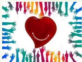
Text: Caritas

In Oberösterreich engagiert sich fast jede/r Zweite/r in einem Verein, einer Organisation, in der Nachbarschaftshilfe oder in einem sonstigen Umfeld. Pro Woche sind das unglaubliche 2,8 Millionen Stunden ehrenamtliche Arbeit, ohne die viele Bereiche unseres Lebens schlecht(er) funktionieren würden. Insbesondere die Blaulichtorganisationen und der Sozialbereich sind auf Freiwillige angewiesen, aber auch die Aufrechterhaltung vieler anderer gesellschaftlicher Bereiche ist ohne Ehrenamt undenkbar. Vereine und Hilfsorganisationen schaffen wichtige Orte der Begegnung, gerade auch für Neuzugezogene, und fördern das gesellschaftliche Zusammenleben. Der hohe Wert für die Gesellschaft zeigt sich aber nicht nur im täglichen Leben, sondern insbesondere auch in Krisenzeiten, wie bei der Aufnahme und Integration von Menschen, die ihre Heimat verlassen (mussten). Für jene, die Freizeit aufbringen, ist es zum einen eine sinnstiftende Tätigkeit, die den eigenen Erfahrungshorizont erweitert. Zum anderen kommen die Ehrenamtlichen mitunter in Situationen, die irritieren, herausfordern und