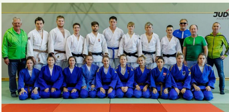
Unsere beiden Bundesliga-Teams

Bester Judoverein Österreichs war der ASKÖ Reichraming nicht nur bei den ASKÖ Bundesmeisterschaften, sondern auch bei großen, stark besetzten Judo-Turnieren wie das Colop-Masters in Wels (340 Starter aus 9 Nationen), oder das intern. Judoturnier in Zeltweg (600 Starter aus 11 Nationen)